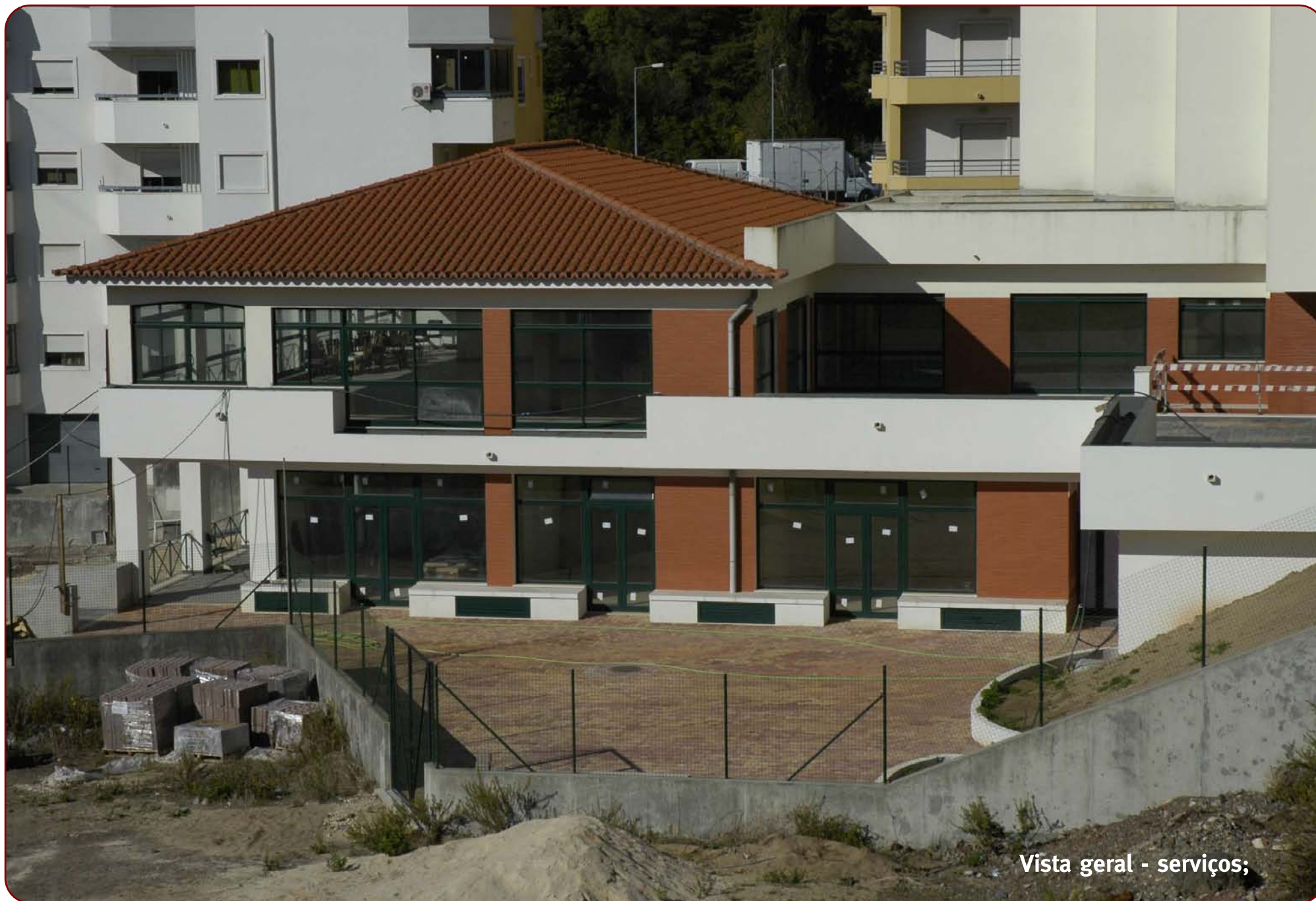
Vista geral - serviços;