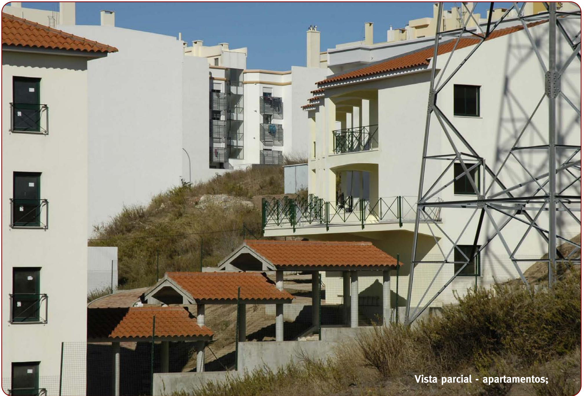
Vista parcial - apartamentos;