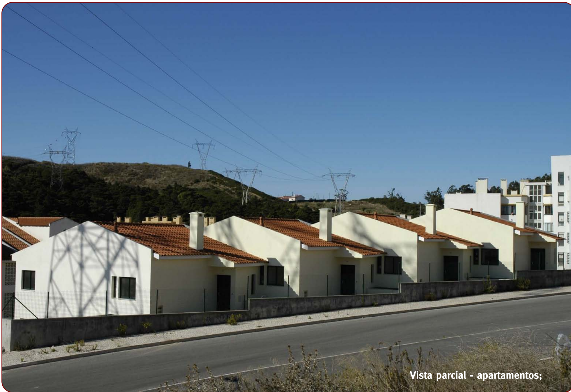
Vista parcial - apartamentos;