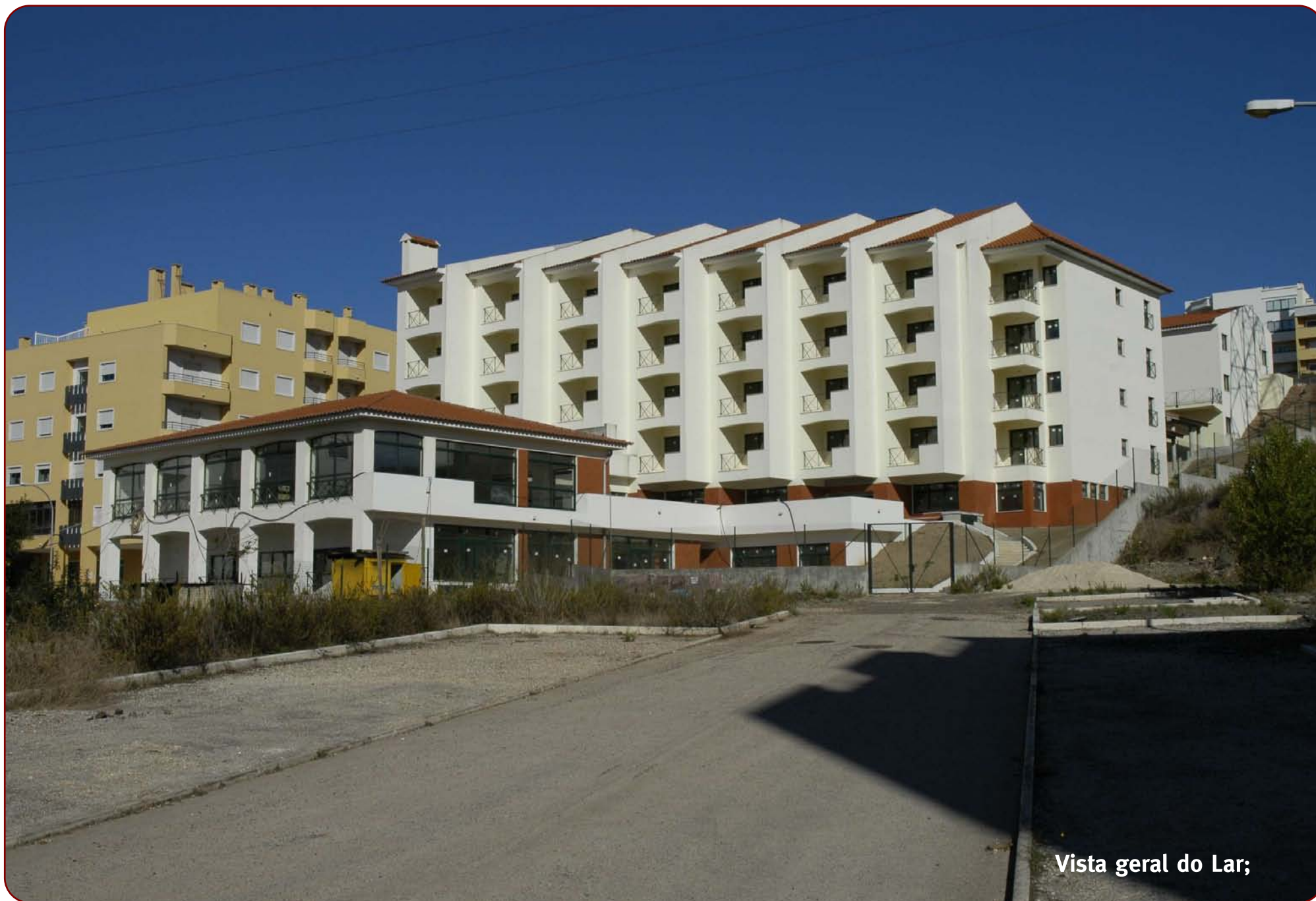
Vista geral do Lar;