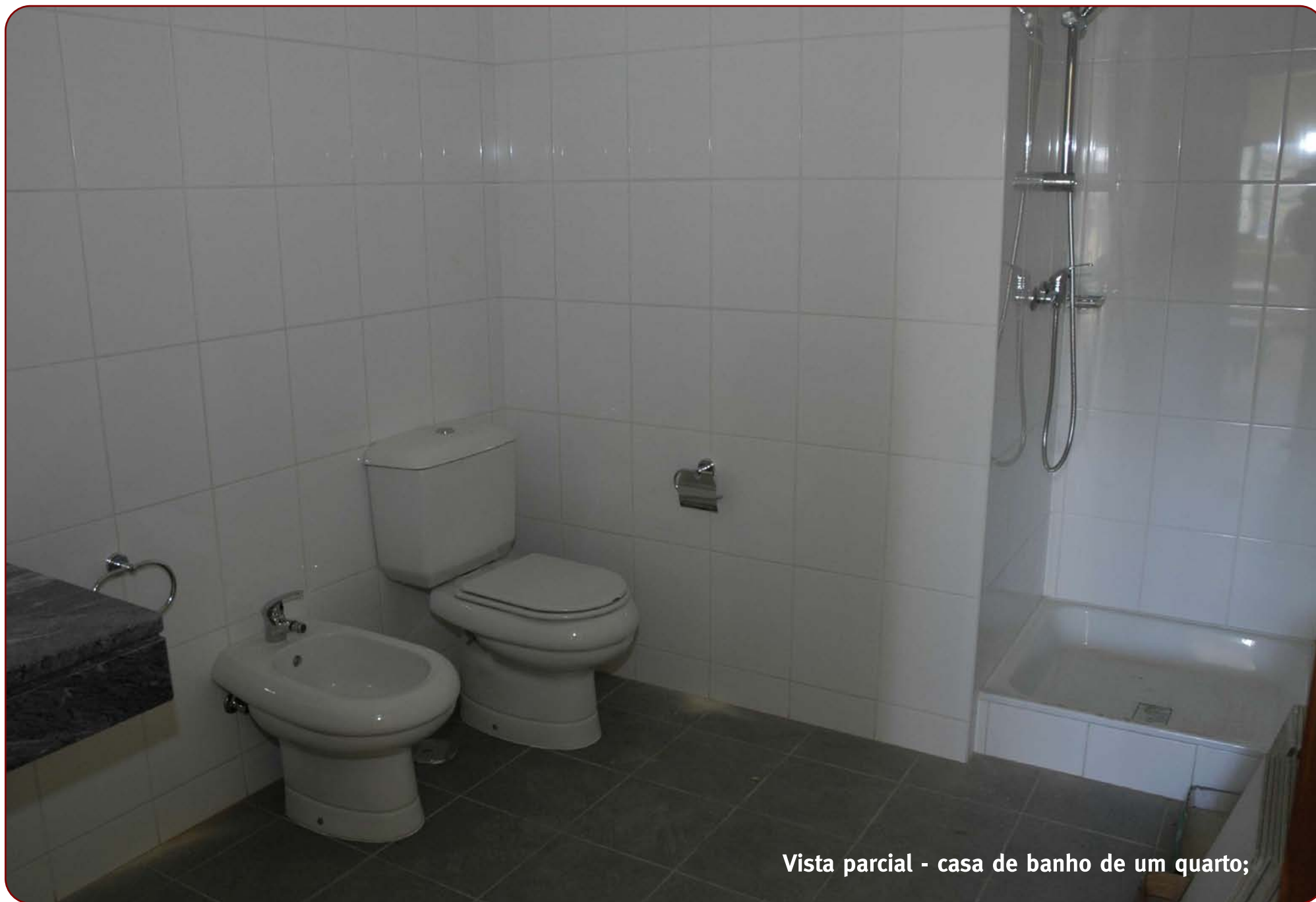
Vista parcial - casa de banho de um quarto;