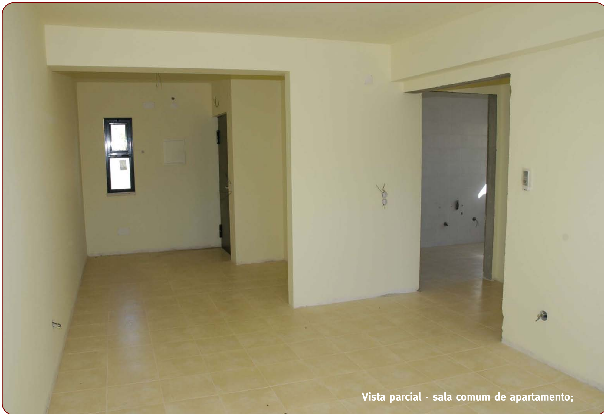
Vista parcial - sala comum de apartamento;