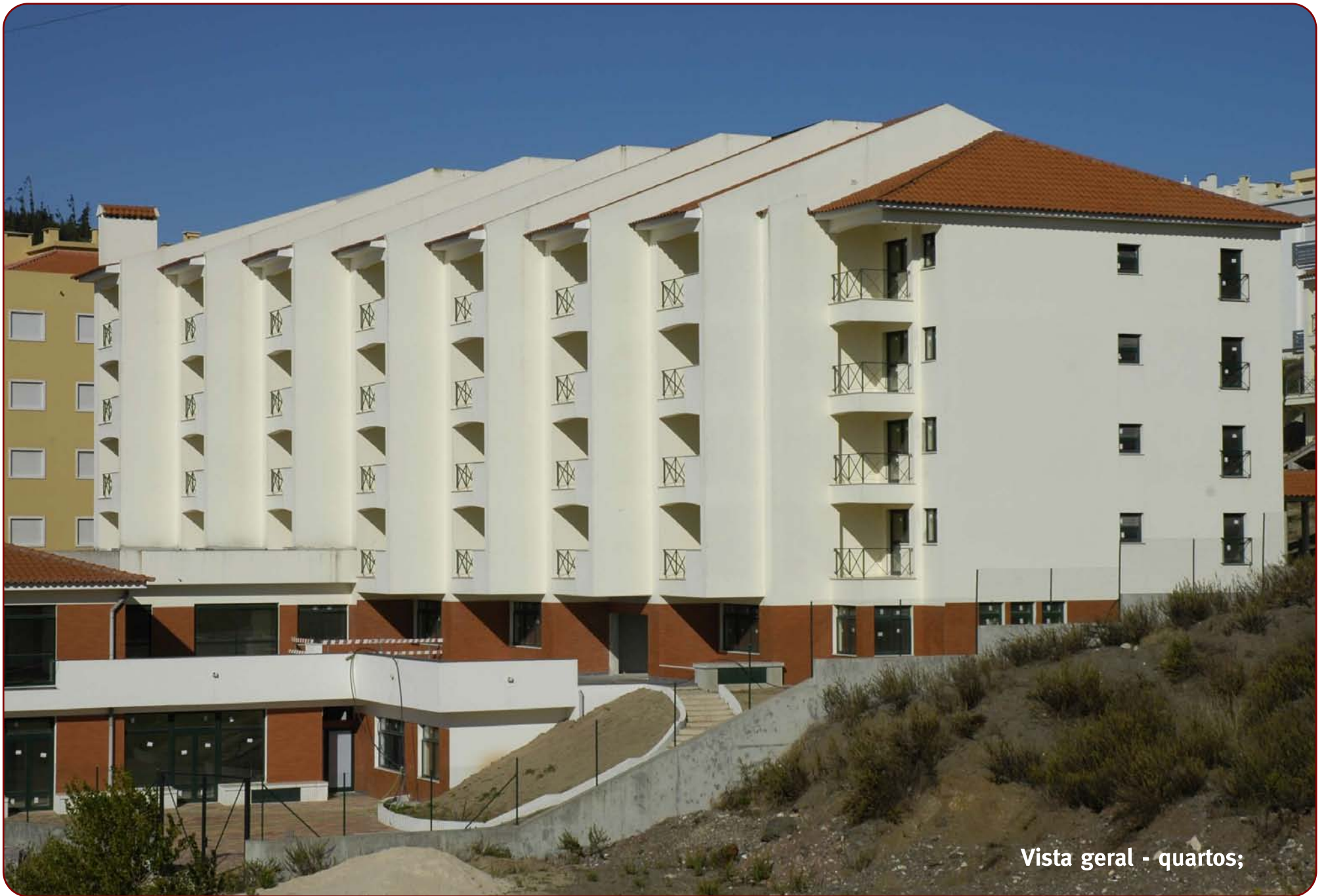
Vista geral - quartos;