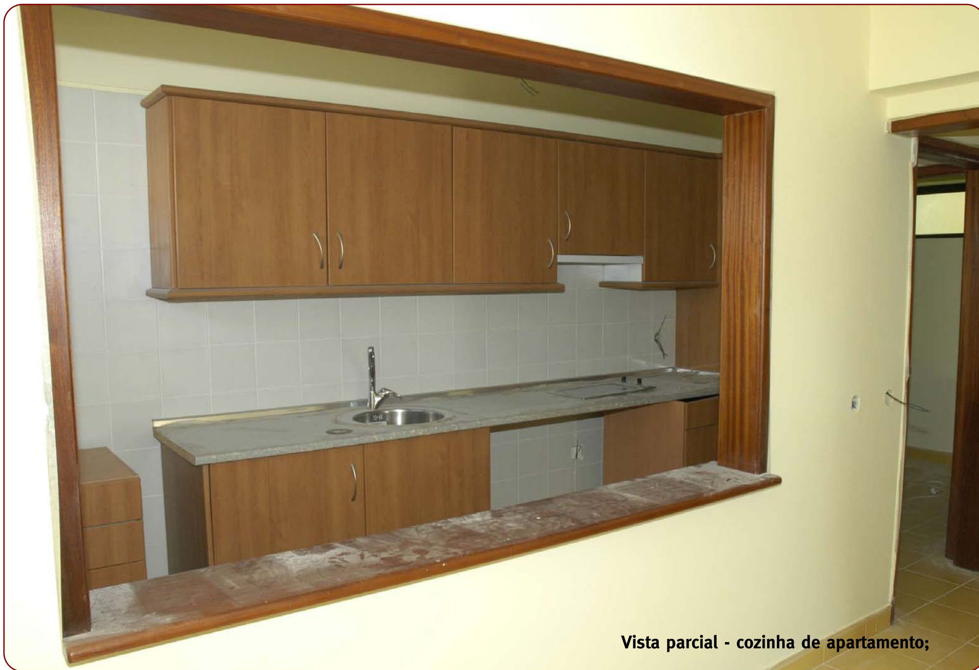
Vista parcial - cozinha de apartamento;