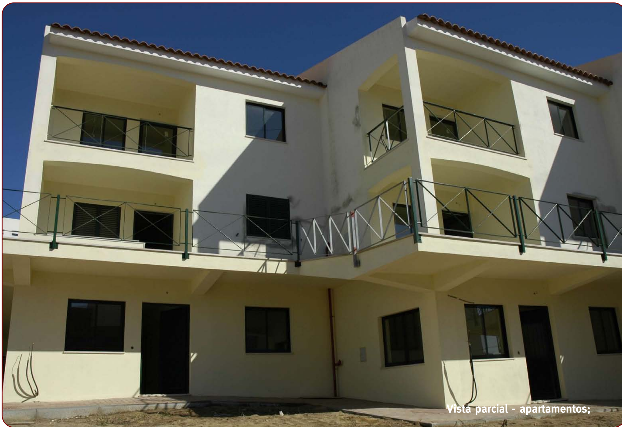
Vista parcial - apartamentos;