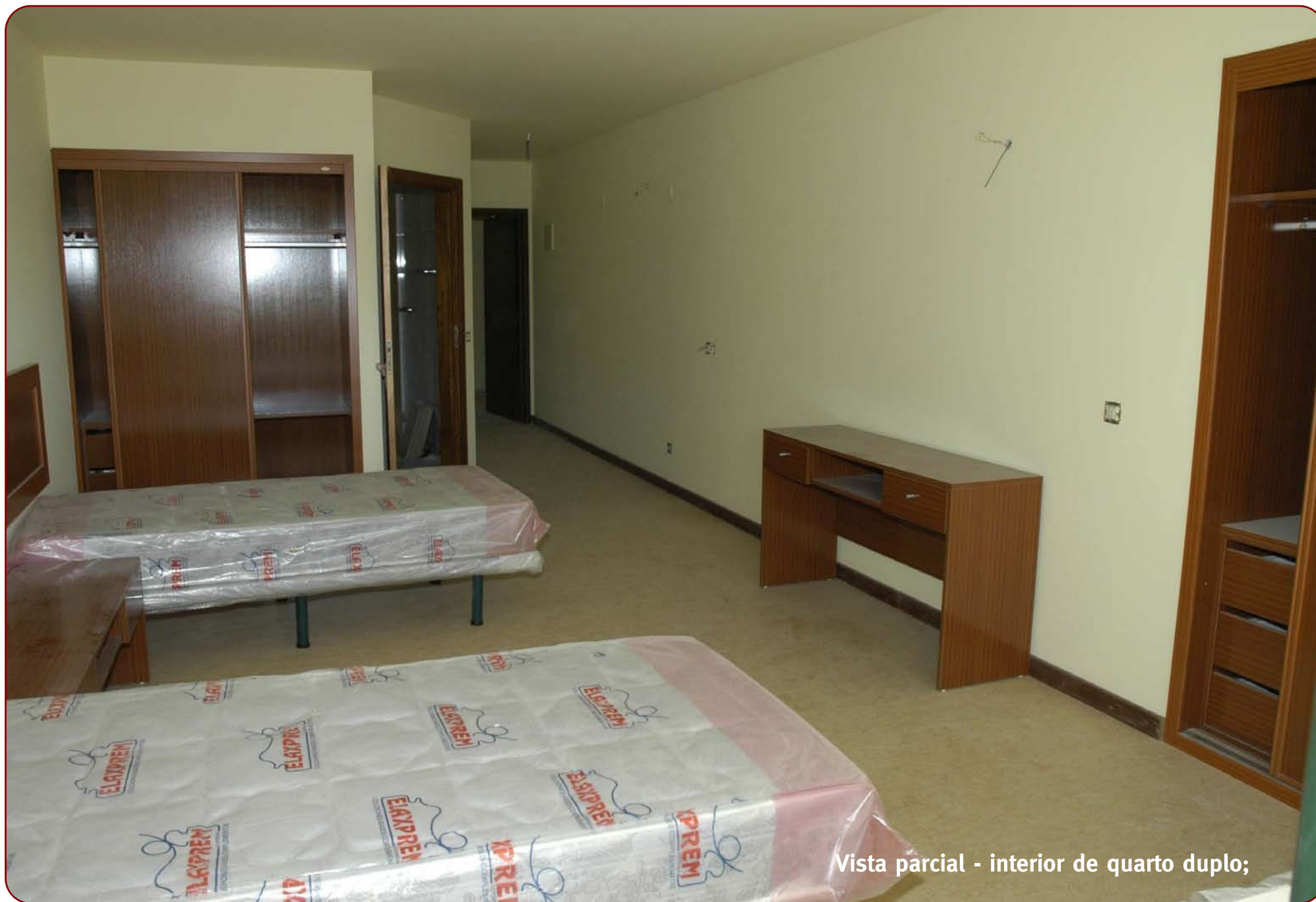
Vista parcial - interior de quarto duplo;