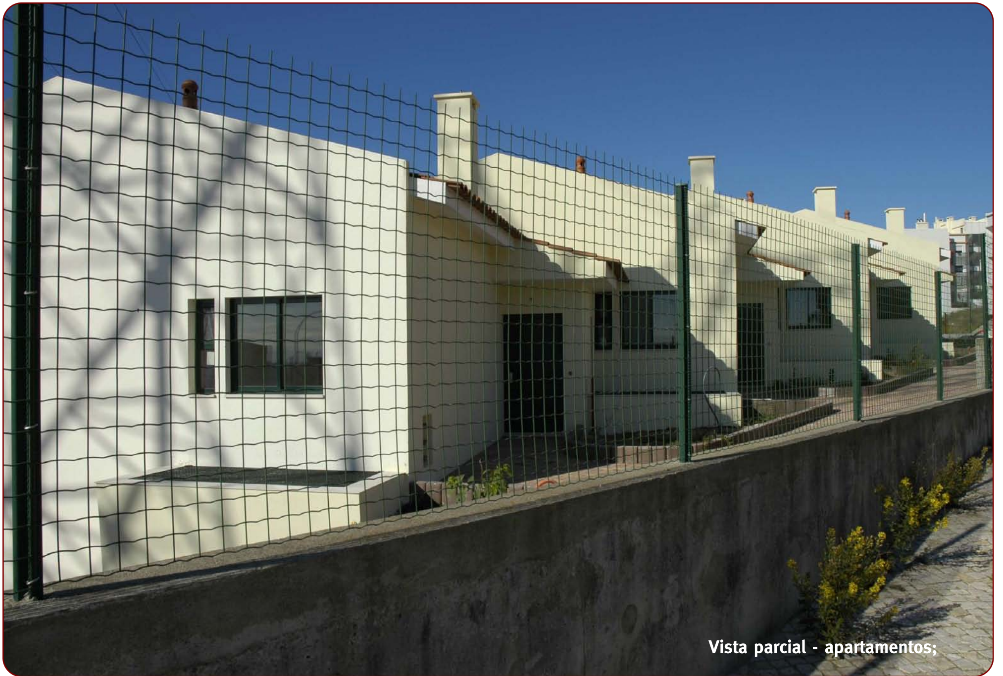
Vista parcial - apartamentos;