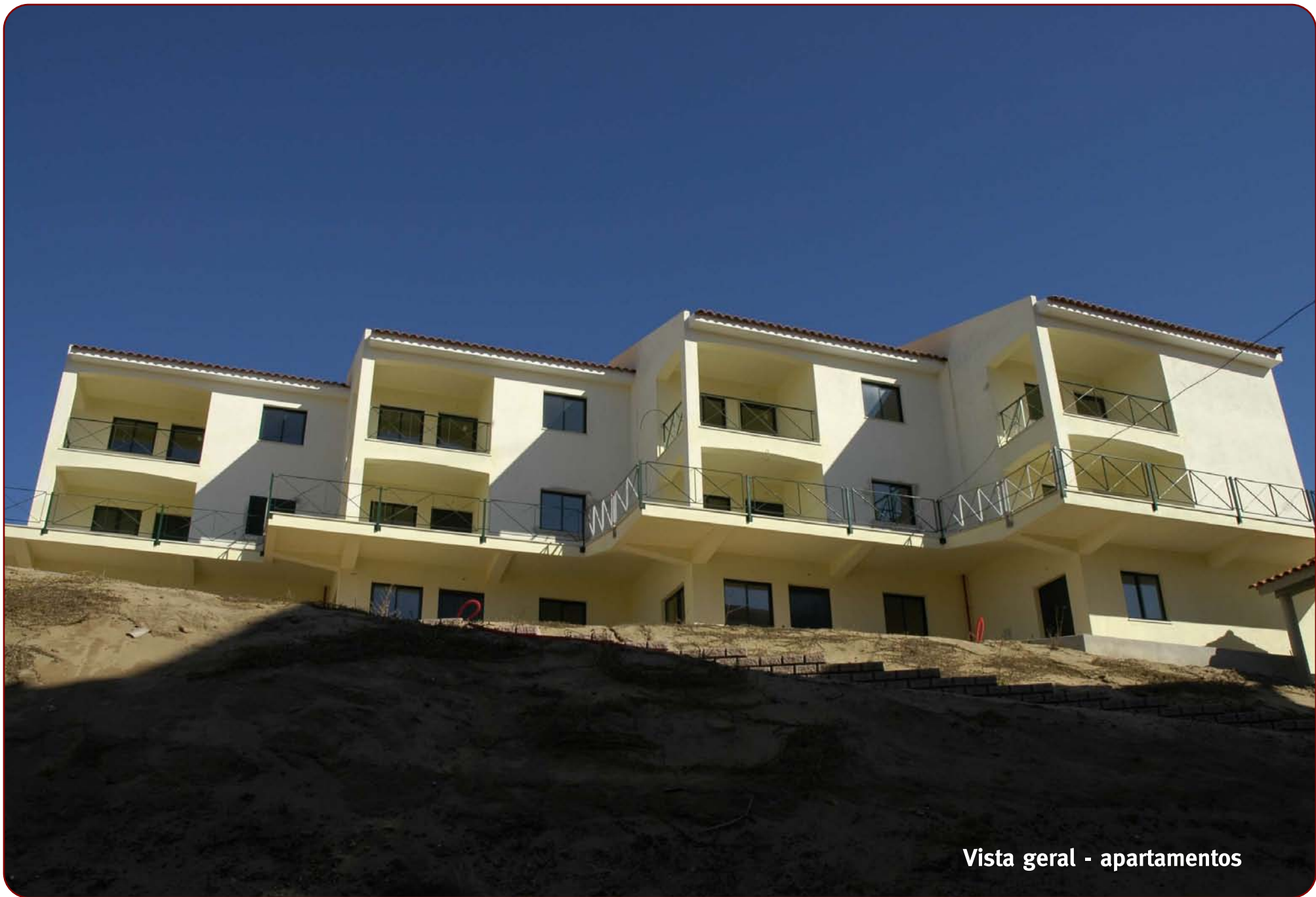
Vista geral - apartamentos