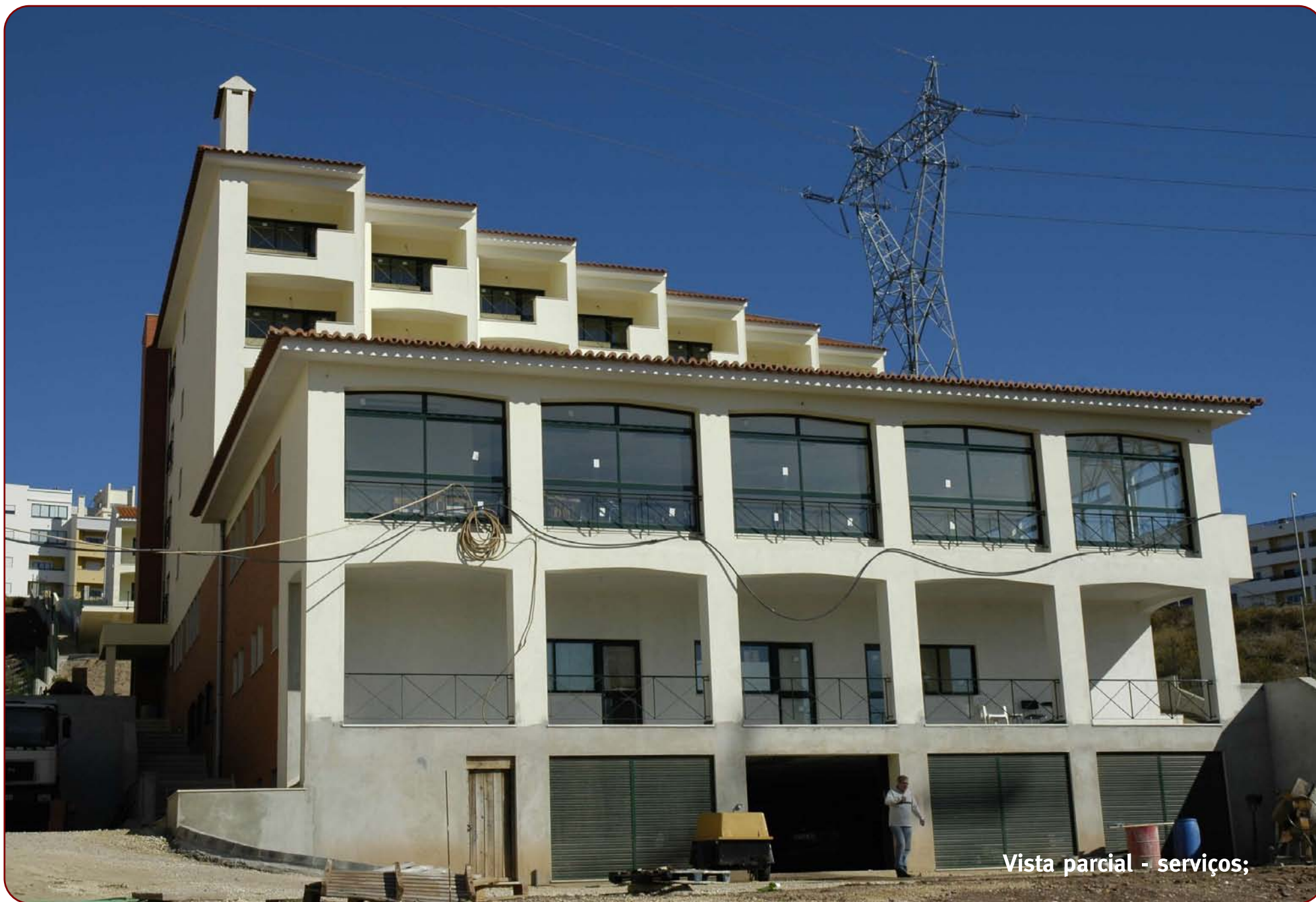
Vista parcial - serviços;