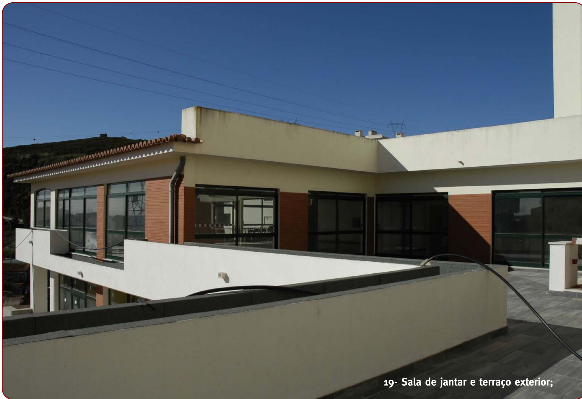
19- Sala de jantar e terraço exterior;