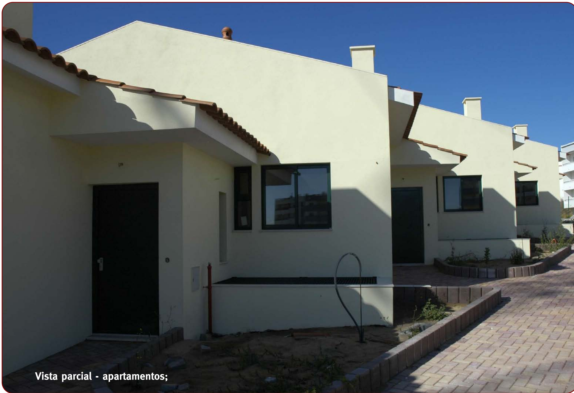
Vista parcial - apartamentos;