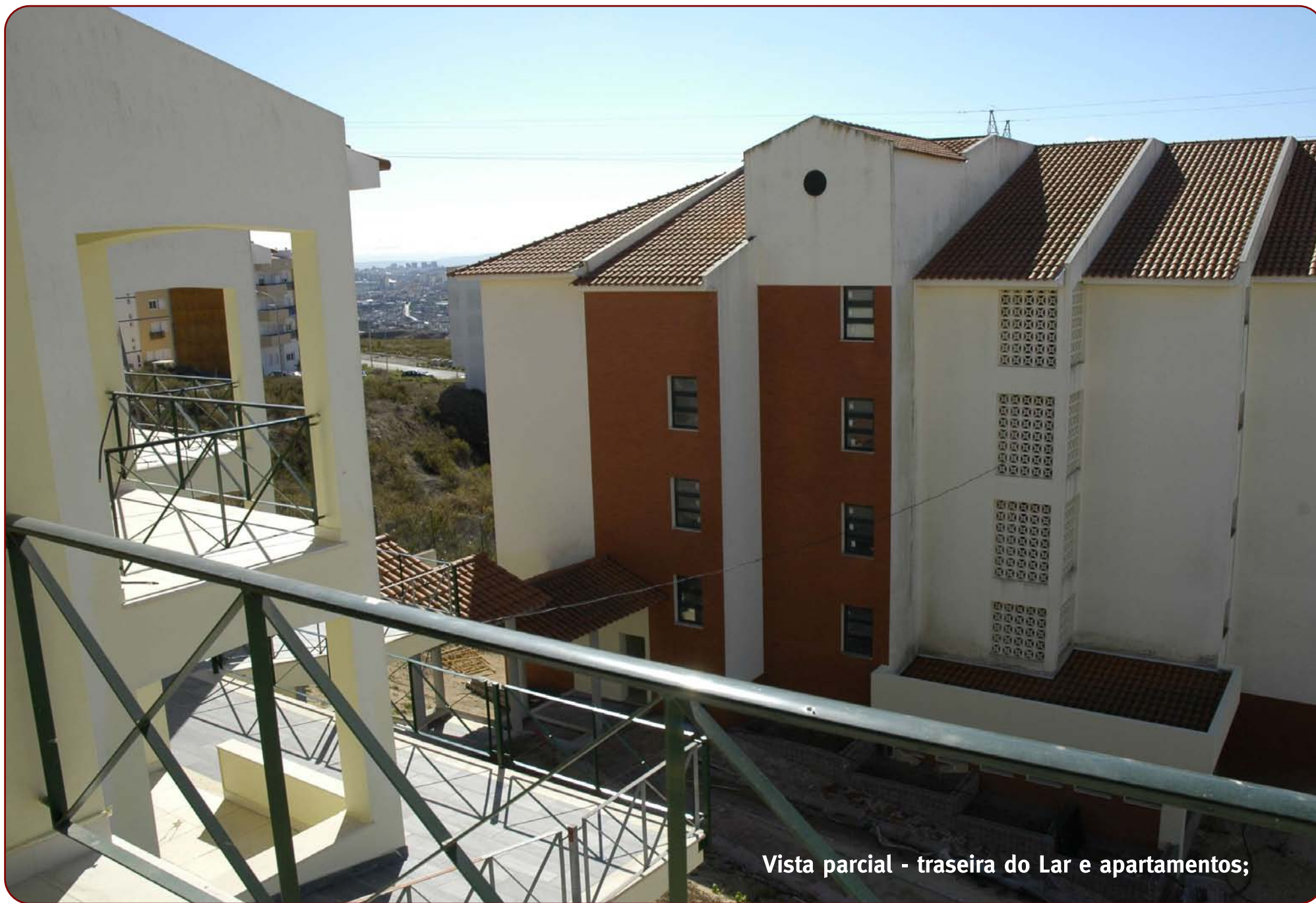
Vista parcial - traseira do Lar e apartamentos;