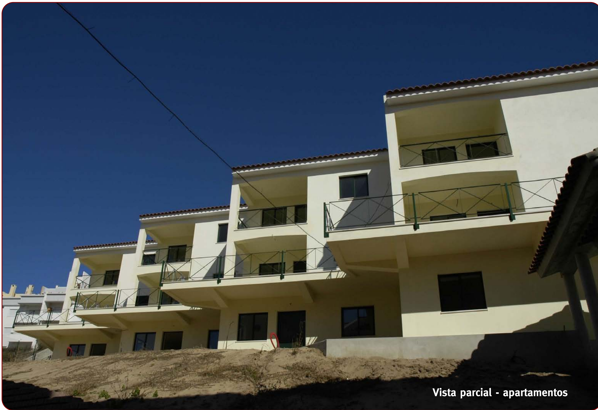
Vista parcial - apartamentos