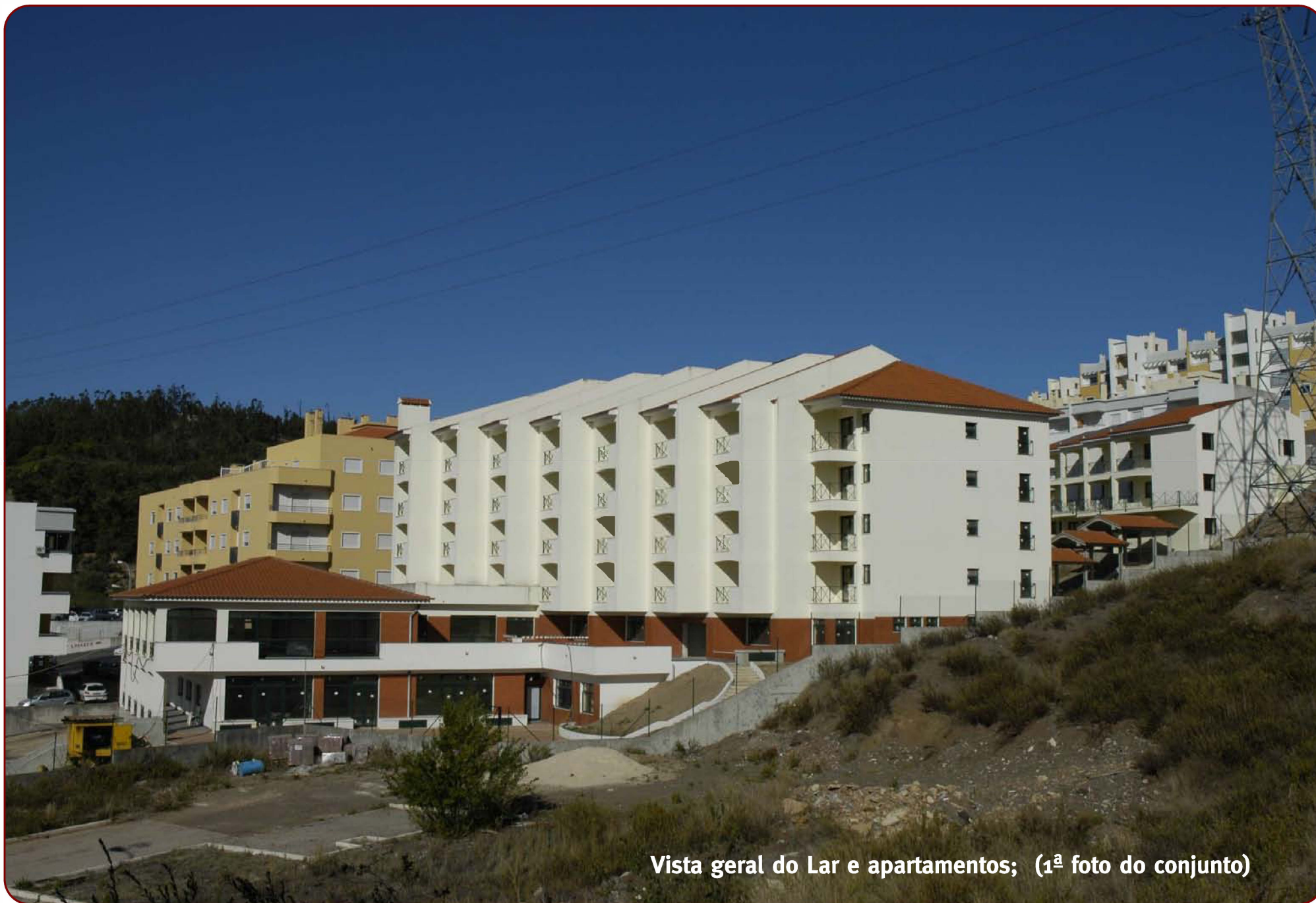
Vista geral do Lar e apartamentos; (1ª foto do conjunto)