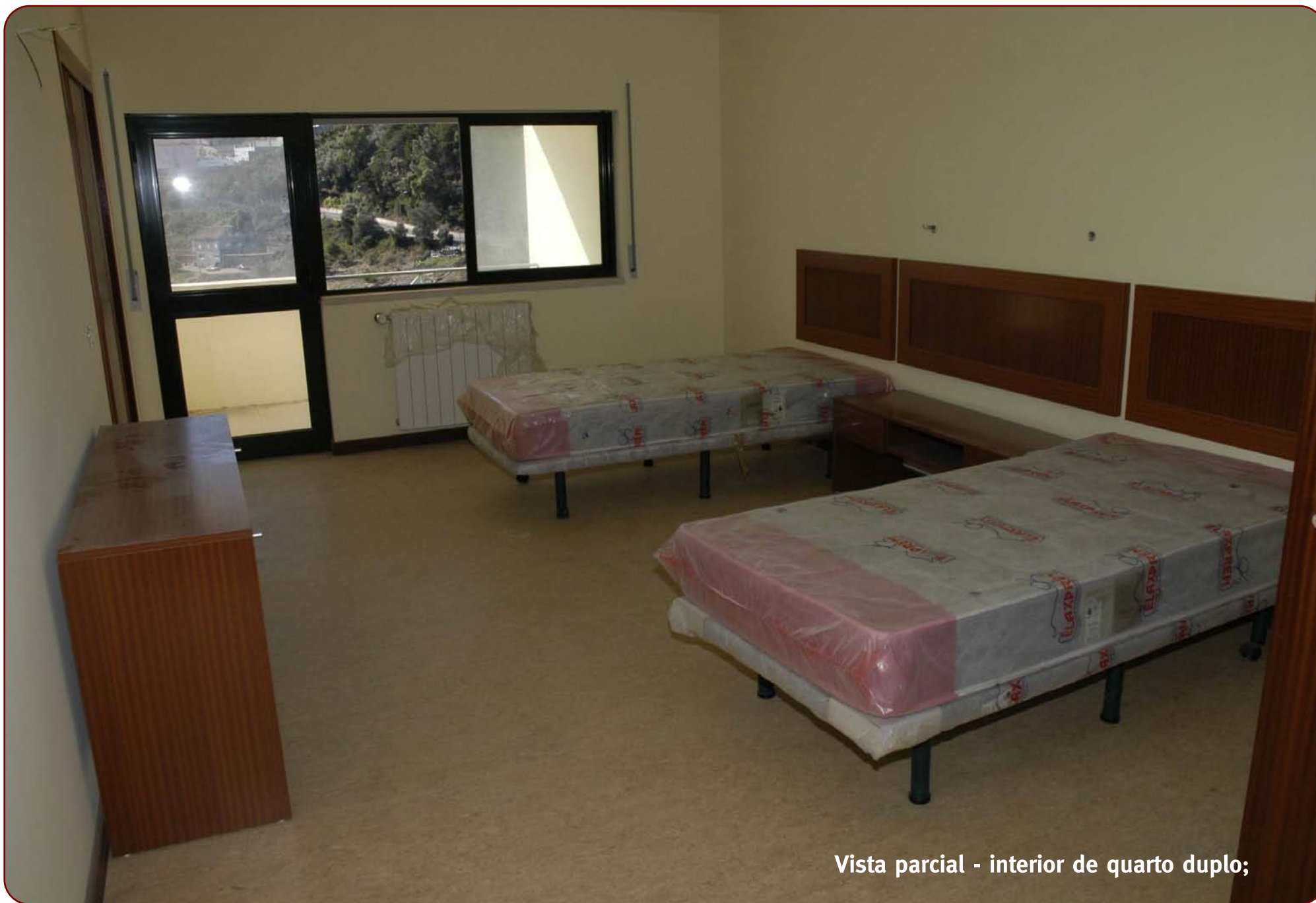
Vista parcial - interior de quarto duplo;