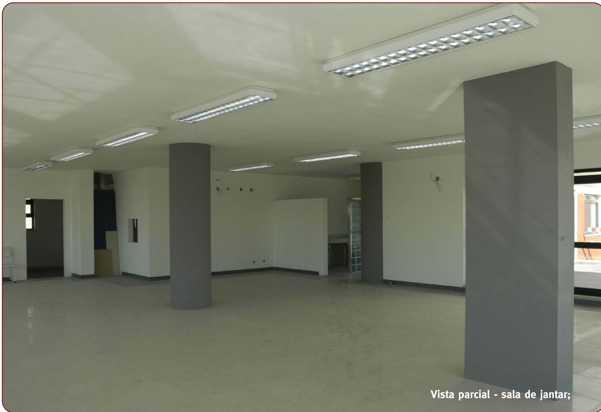
Vista parcial - sala de jantar;