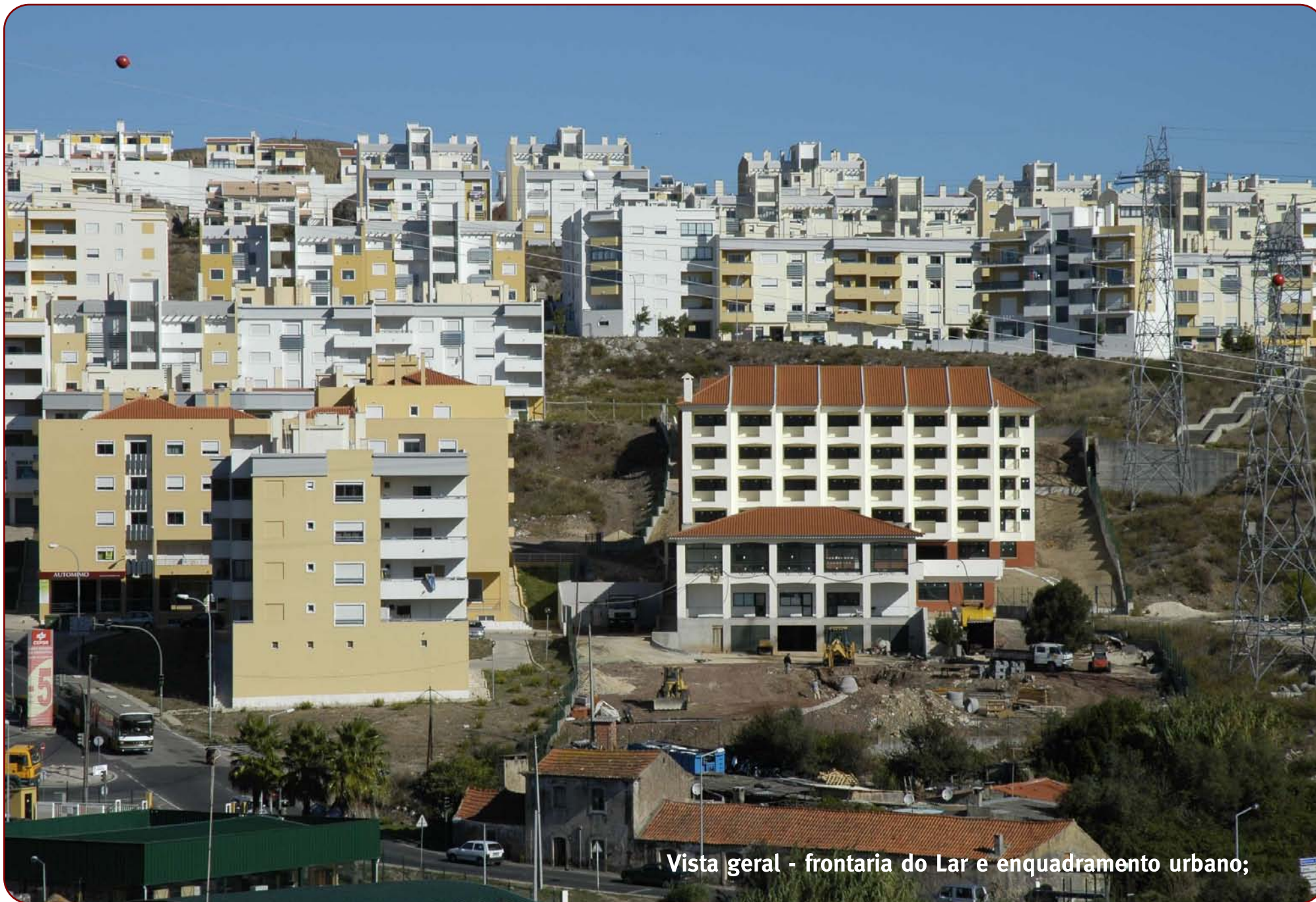
Vista geral - frontaria do Lar e enquadramento urbano;