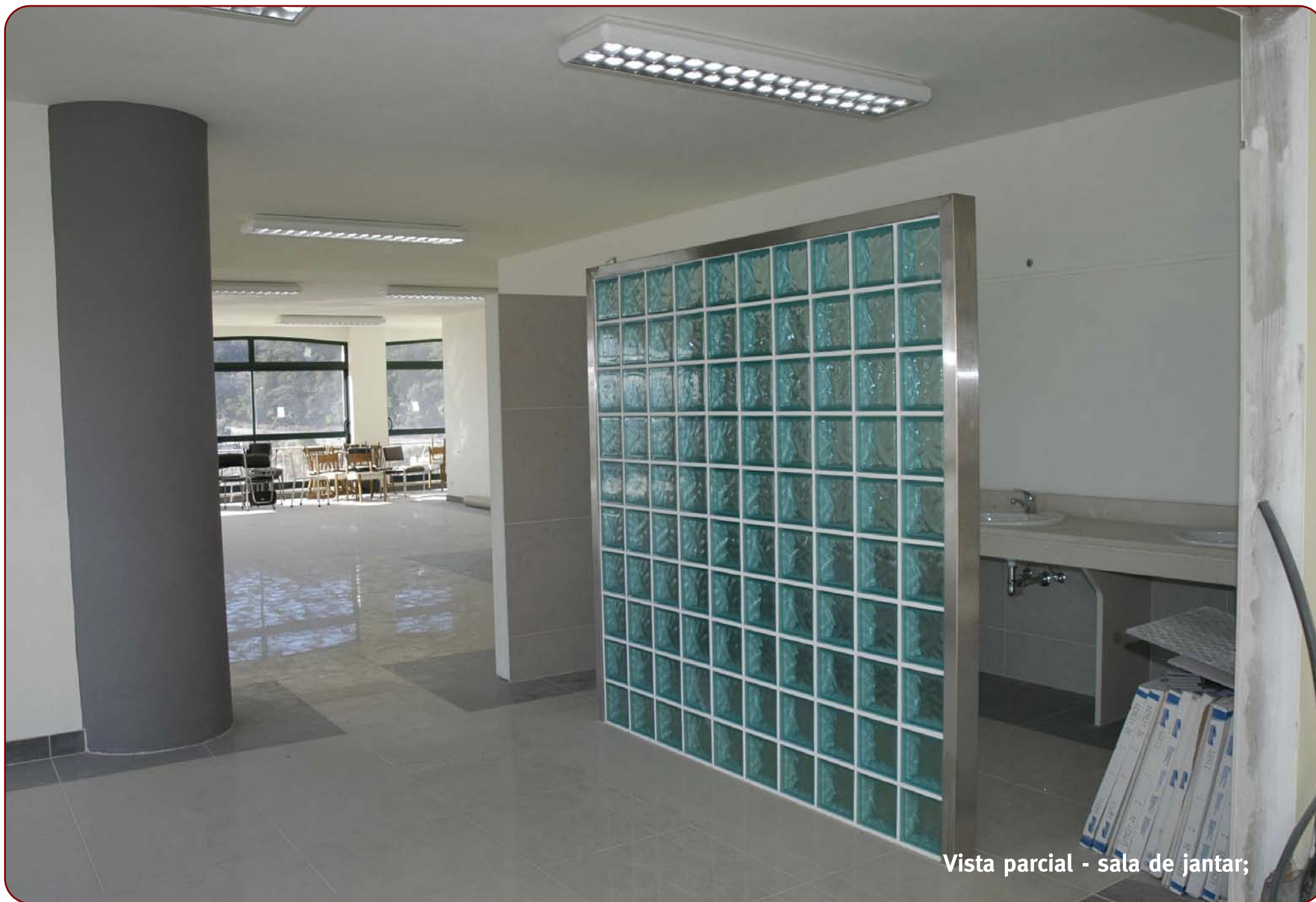
Vista parcial - sala de jantar;