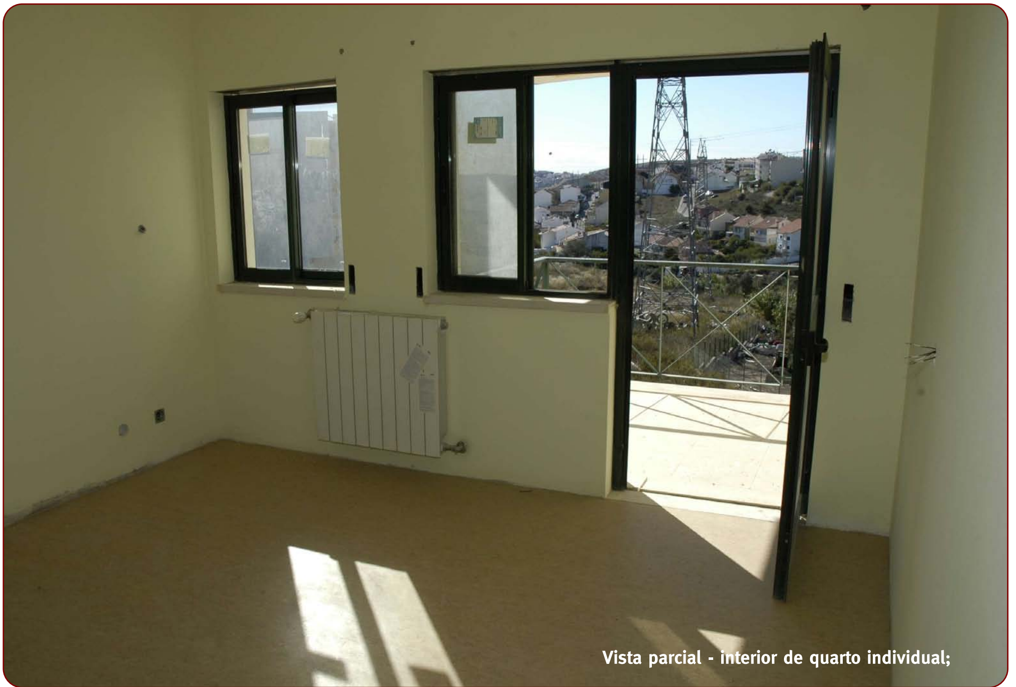
Vista parcial - interior de quarto individual;