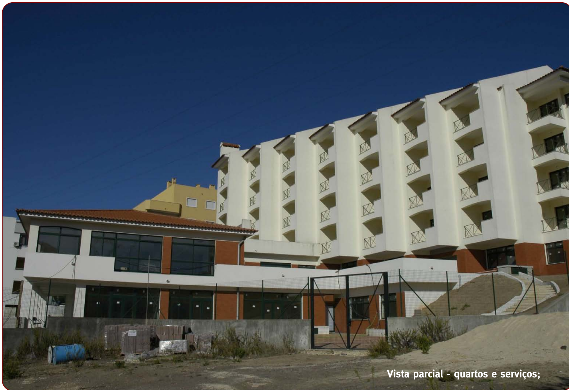
Vista parcial - quartos e serviços;